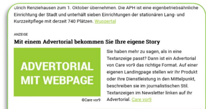
Darstellung im Newsletter

Sollten Sie keinen Text für das Advertorial liefern können, bieten wir Ihnen an, den Text zu schreiben. Dafür berechnen wir 500 Euro. Das Advertorial ist nicht weiter rabattfähig. Bei Schaltung über eine Mediaagentur gewähren wir 15 Prozent Agenturprovision. Alle Preise zuzüglich Mehrwertsteuer.