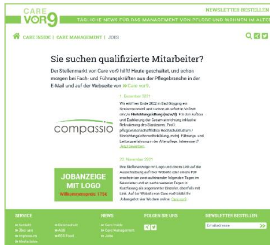
Darstellung auf der Website