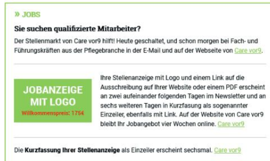
Darstellung im Newsletter