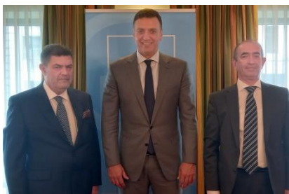
Athanasios Kapellas, Minister Vassilis Kikilias und Nestor Balaskas beim Gespräch in Deutschland