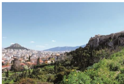
Ob Athen oder Insel – im Winter entdecken Gäste ein ganz neues Griechenland